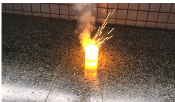
表八、不同水溫下的鉀遇水反應起火燃燒的影響