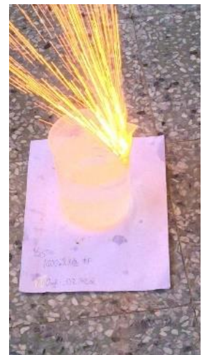
表六、35°C水溫下不同水量對 0.2 克鈉遇水反應起火燃燒的影響